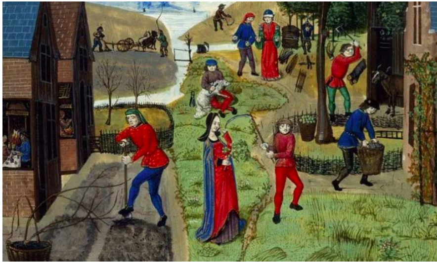
Şekil 2 Köy Yaşamı

Feodalizm, toplumsal ilişkileri itaat ve koruma alışverişine indirgeyen bir sistemdir. İtaat edenleri, yani Feodal yapı içerisinde yaşayan köylüleri niteleyen birçok sınıf vardı. Fakat bu sınıflar arasındaki farklar son derece muğlak olmakla birlikte zaman içinde görünmez olmuş ve ortak bir köylü sınıfına dönüşmüştür. Başlarda Şarlıman döneminde serflik veya kölelik ile bağımlı köylüler (colonus) arasındaki fark netken, birkaç yüzyıl içerisinde benzer anlamlara gelmeye başlamıştır. Zaten akla gelen ilk anlamıyla kölelik, dini olarak olumsuz karşılanan bir durumdur. Bunun yanında köle azadı teşvikleri ve lordların aslında azat işlemleriyle pek bir şey kaybetmemesi köle sayısını süreç içerisinde hızla azalttı. Bunun yerine kiralanan toprağın kirasını ödeyen ve bunun yanında senyörün angarya işlerini de gören bağımlı çiftçiler/köylüler çok daha verimli bir ekonomi oluşturmuştu. Toprak sahipleri bu şekilde çalışanlarını beslemek zorunda da kalmıyordu. 6 Yine de toprağa bağımlı köylüler, köyden ayrılmak veya dışarıdan evlilik yapmak için senyörden izin almalıydı. İzinsiz şekilde topraklarından ayrılmak veya sadakat yeminini bozmak korkunç bir suç olarak kabul ediliyordu. 7 Nihayetinde, toprak başka bir senyöre satıldığında ona bağlı serfler de toprakla beraber yeni senyörün himayesine devroluyordu. Bu yapı içerisinde, Orta Çağ'ın başlarında köylüler sadece hayatta kalmaya çalışırken yüzyıllar geçtikçe daha iyi yaşam şartlarına kavuştular.